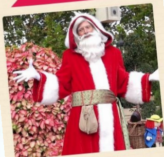
«Пер-Ноэль» (Père Noël)