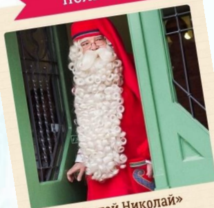
«Святой Николай» (Święty Mikołaj)