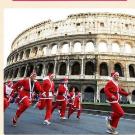
«Баббо-Натале» (Babbo Natale)